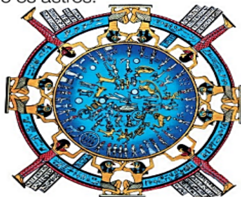
▲ A observação dos astros serviu de referencial para a organização do calendário egípcio.

Os povos que habitavam o continente americano em tempos remotos também desenvolveram diferentes maneiras de medir e marcar a passagem do tempo. Os astecas (povo que habitou a região central da América antes da chegada dos europeus), por exemplo, elaboraram um calendário dividindo o ano em 18 meses. Cada mês tinha 20 dias e era representado por um símbolo. Havia ainda 5 dias dedicados aos sacrifícios, completando os 365 dias do ano solar.