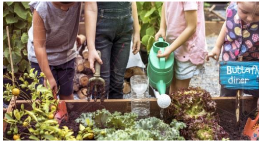
Figura 1 wp-content/uploads/2018/11/10-attitudes-sustentaveis-escolas-thumb.jpg