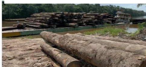
Figura 1 . Desmatamento. https://ainfo.cnpqia.embrapa.br/digital/bitstream/item/94212/1/Ecosystema-cap3C.pdf . Acesso em: 26 jul. 2020.