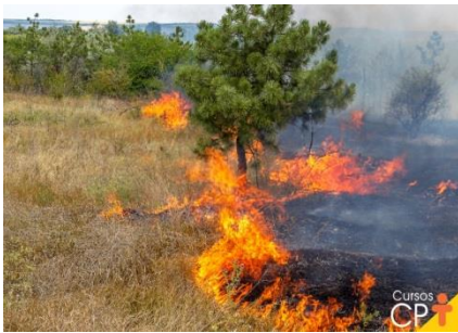
Figura 2 https://cptstatic.s3.amazonaws.com/imagens/enviadas/materias/materia27392/impactos-ambientais-o-que-sao-e-suas-consequencias-no-meio-ambiente.jpg

c) Identifique os impactos ambientais na fotos abaixo. Marque.