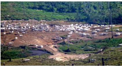
Figura 3 https://lh3.googleusercontent.com/proxy/l4ojNLA3ZYg6hwo bA9gtGDClrpSLiUID7B4Y3dmOuOJ8G1pe1bXD6VEvJmcc6r8bJag TMfBKKjn1Xn2bY7pWC1RXk2oRWeUZNIi3YcFybt8JZcl1_-mM11_K4fc-9CP1k4k6TfY78mVla13F1E5C0zMM3cQ17E_00