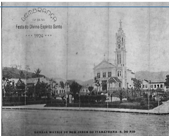
Figura 1 https://3.bp.blogspot.com/-n87wJl7JWxE/V4zZ_hN75EI/AAAAAAAAa1U/mv_pe5SFTGQFro6Q1M-yH-SmB6CPYGbcACEw/s640/festa%2Bdo%2Bdivino%2B1924%2Beditada.jpg

Em 1860, chegou por estas terras, a família Teixeira de Siqueira. Foram eles que marcaram o início das Festas do Divino Espírito Santo em nosso Município. Embora sendo uma festa religiosa, foi esta festa, que deu origem a nossa tradicional Festa de Agosto, que então deu início a outras atividades, como: quermesse, leilões, barraquinhas de venda das especialidades locais, shows com artistas da terra, etc.