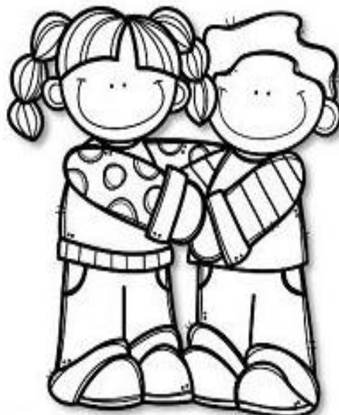
CUMPRIMENTAR O COLEGA