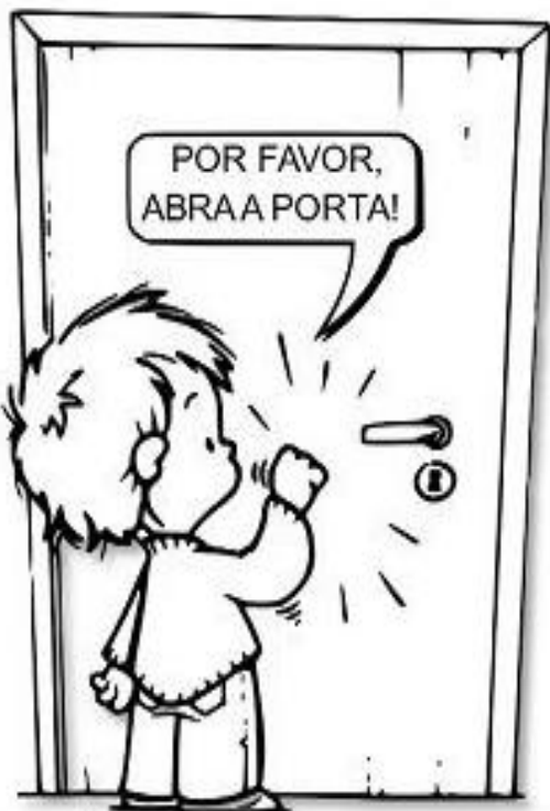
BATER À PORTA ANTES DE ENTRAR