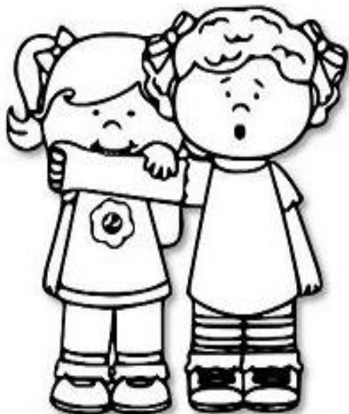
MORDER O COLEGA

CIRCULE AS CENAS QUE INDICAM BOAS MANEIRAS: