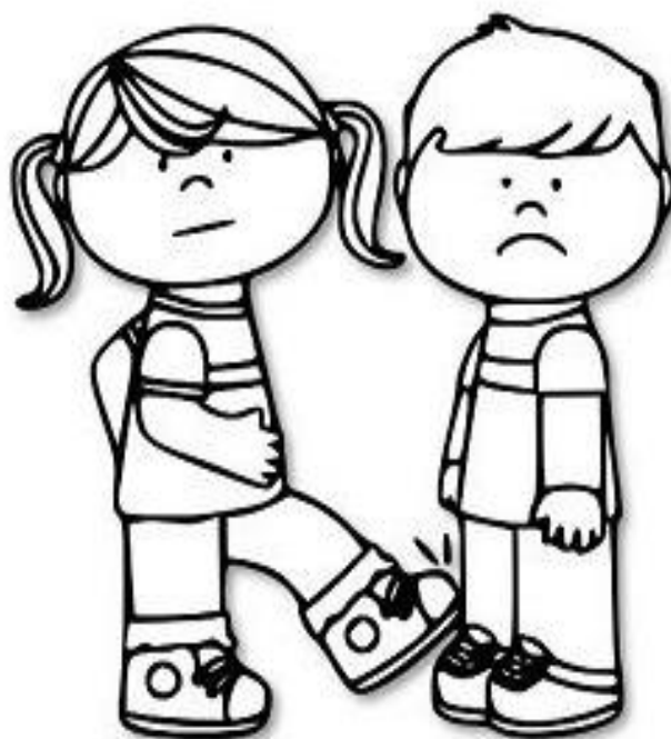
PISAR NO PÉ DO COLEGA.