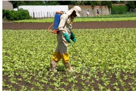
Trabalhador aplicando agrotóxico em plantação.

Além de essencial para as atividades do campo e da cidade, a ÁGUA é fundamental para matar a sede, fazer a higiene pessoal, preparar alimentos, entre outras atividades. Ou seja, sem água, não vivemos. Por isso, é importante manter a qualidade da água e garantir que ela seja utilizada sem desperdício.