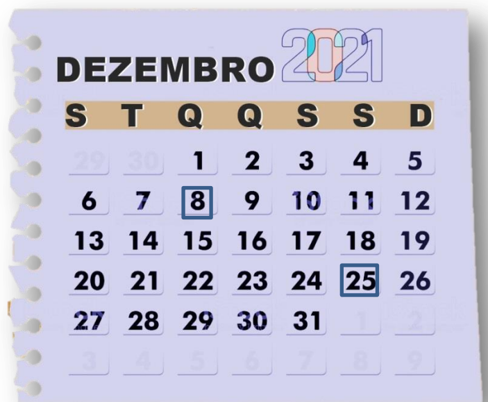
Figura 1 dia 08/12 - feriado municipal - Imaculada Conceição