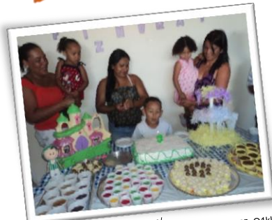
Figura 1 http://4.bp.blogspot.com/-qpDwMknjRcA/USzty6bHdQI/AAAAAAAAAEsQ/4WE5qQ1klu0/s1600/DSC01496.JPG

02 Forme frases de acordo com a ilustração.