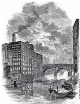
Panorama da cidade Inglesa de Manchester, em 1850, em que se observa o crescimento urbano, representado pelas chaminés e fumaça das fábricas, poluindo o meio ambiente.

Chamamos de Revolução Industrial ao conjunto de mudanças ocorridas na produção de mercadorias e no modo de viver das pessoas na Inglaterra, na segunda metade do século XVIII, e que se expandiu para outros países no século XIX. Não estamos falando de uma revolução como uma revolta política, e sim no sentido de profundas transformações socioeconômicas e tecnológicas.