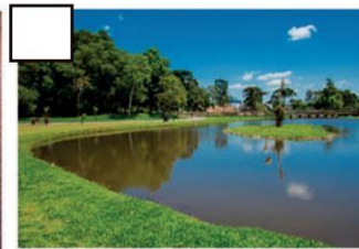
Parque das Águas - Foto: Bruno Oliveira / Prefeitura de Piraquara.