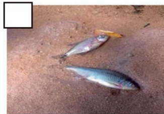
Peixes mortos encontrados na beira do rio.