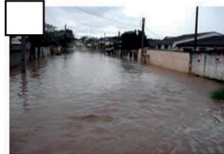
Alagamento em um bairro de Piraquara.