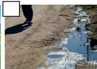
Esgoto a céu aberto: https://www.tribunapr.com.br/