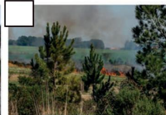
Queimadas na área rural.

Que conclusão você chegou? O lugar onde você vive tem qualidade ambiental? Por quê?