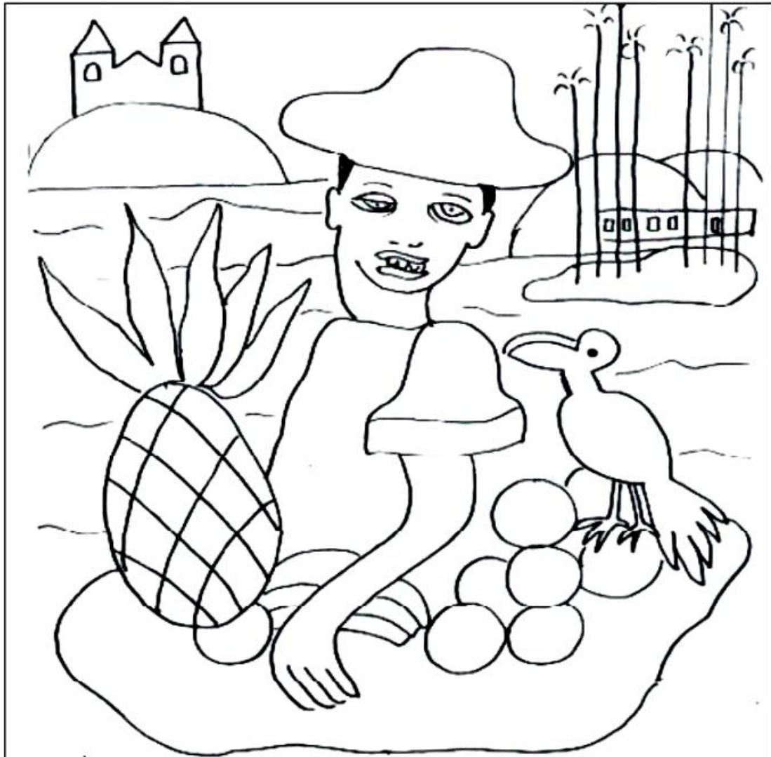
Vendedor de Frutas (1925).