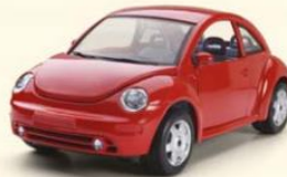
3. car / James