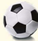
5. ball / the children