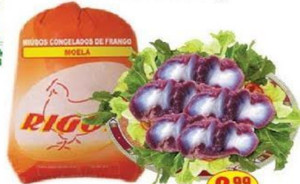
Moela de Frango Rigor Pacote - kg