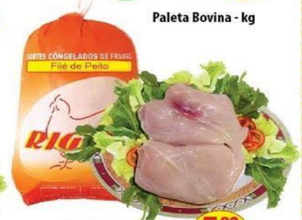
Filé de Peito Rigor Pacote - kg