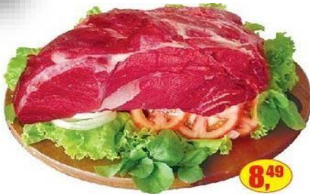
Acém Bovino - kg

01 Observe o folheto do supermercado e responda as perguntas abaixo.