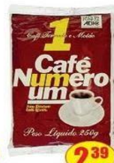
Café Numero Um Pacote - 250g