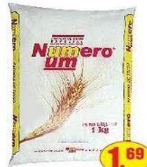
Farinha de Trigo Numero Um Especial Pacote - 1kg