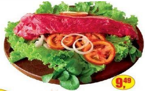
Paleta Bovina - kg