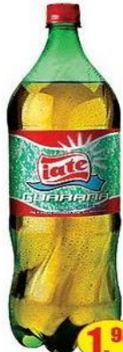
Refrigerante late - 2l