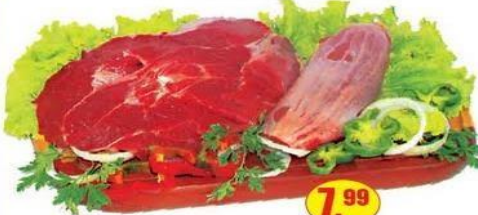
Músculo Dianteiro - kg