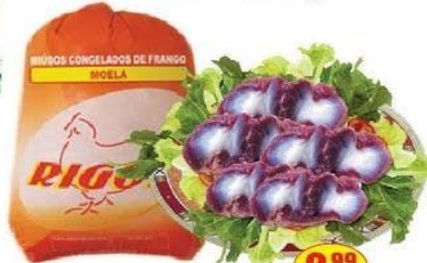
Moela de Frango Rigor Pacote - kg