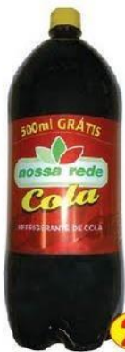
Refrigerante Nossa Rede - 2,5l