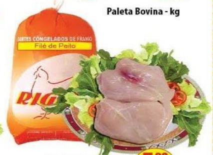
Filé de Peito Rigor Pacote - kg