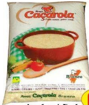
Arroz Caçarola Tipo 1 Branco ou Parboilizado - 5kg