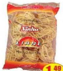
Massa Vitaminada Liane Pacote - 500g