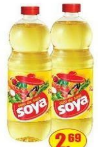
Óleo de Soja Soya Pet - 900ml