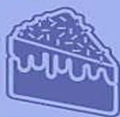
Bolos com recheio e cobertura