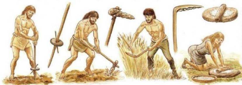
Pau de Escavar