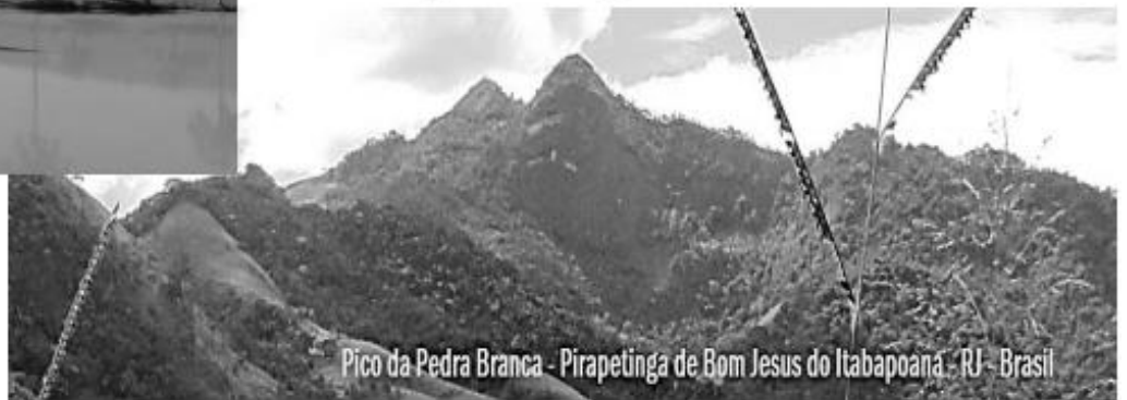
Pico da Pedra Branca - Pirapetinga de Bom Jesus do Itabapoana - RJ - Brasil

1- Observe as imagens acima e escreva quais elementos predominam nelas.