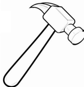
( C )