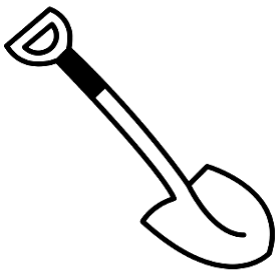
( A )

A) QUAL DAS FIGURAS ABAIXO TEM A MESMA QUANTIDADE DE SÍLABAS DA FIGURA EM DESTAQUE?