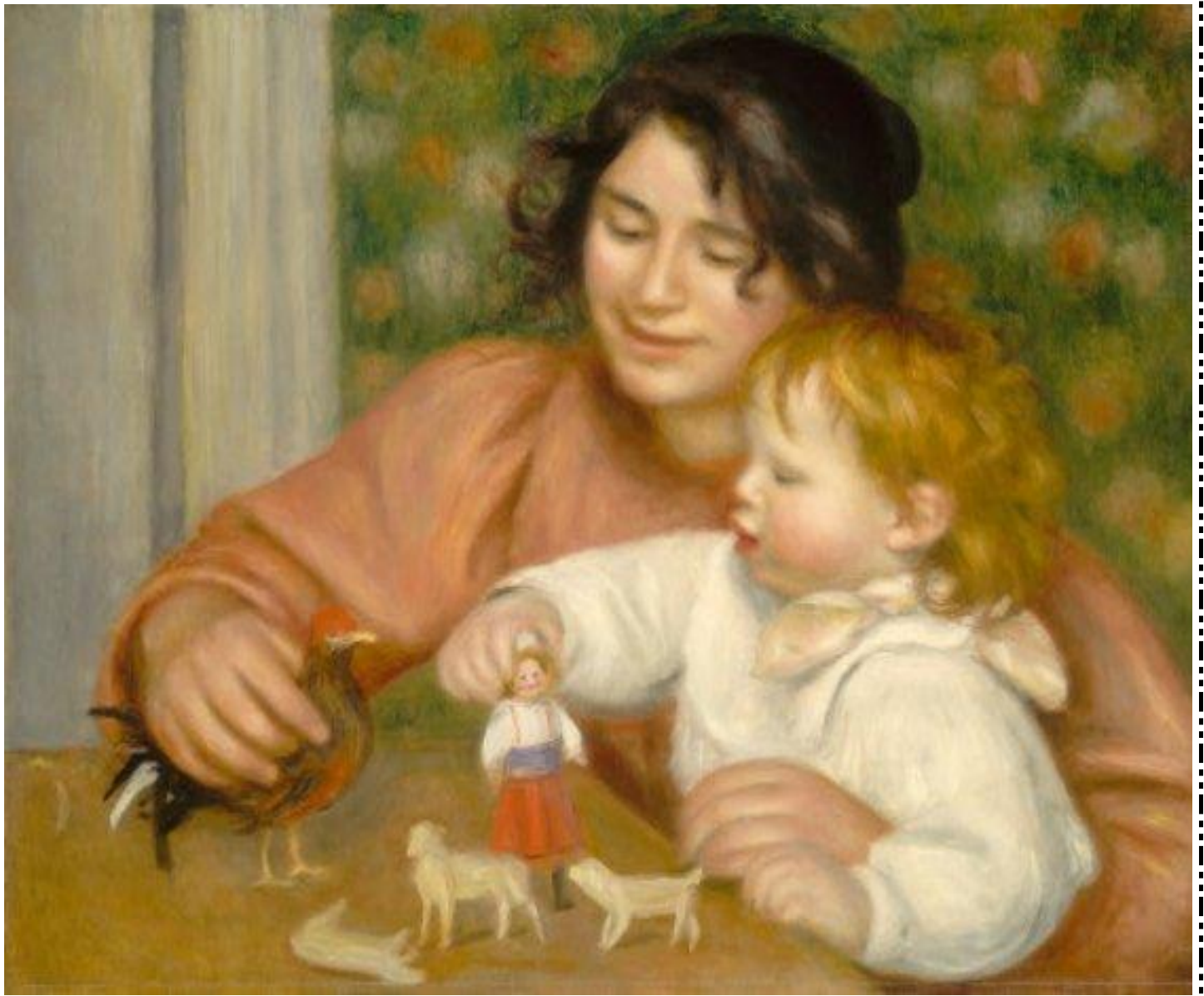
RENOIR, Pierre-Auguste. Criança com brinquedos.