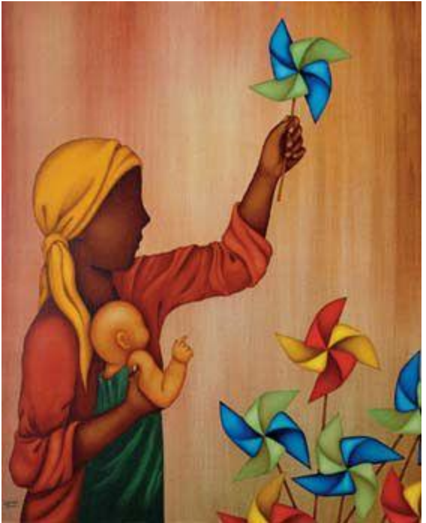
Catavento, de Luciana Teruz (Brasil 1961)