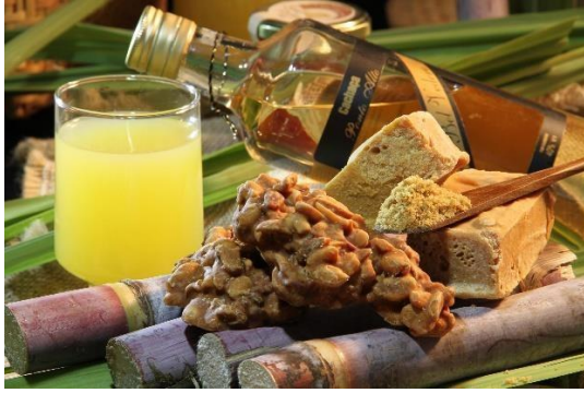
Alimentos e bebidas

2- Além do açúcar, a cana-de-açúcar é matéria-prima de diversos produtos.