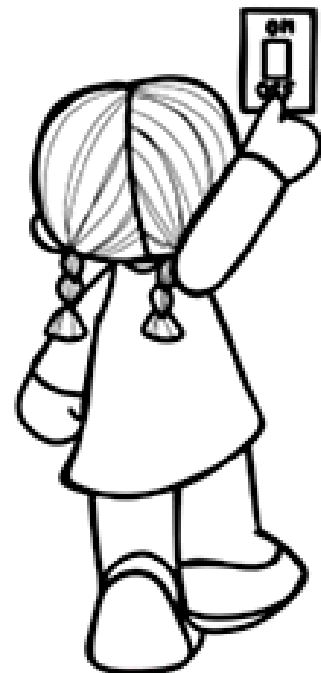
APAGAR A LUZ.