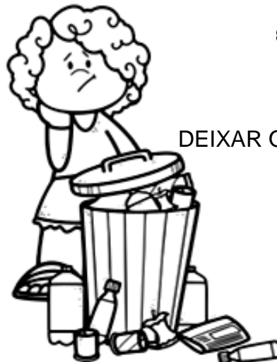
DEIXAR O LIXO ESPALHADO.