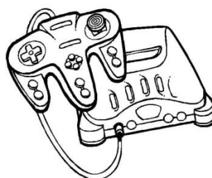
VIDEOGAME R$ 70,00