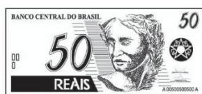
QUANTIA DE PEDRO R$ 50,00

Quanto sobrar de troco se Pedro comprar a pipa?