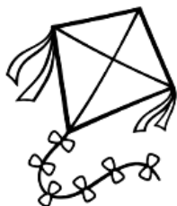
PIPA R$ 30,00

2. Pedro passou em frente a uma loja e viu uma pipa em promoção, então, resolveu comprá-la. Observe abaixo o preço da pipa e a quantia que Pedro tinha: