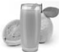
SUCO DE GOIABA R$ 3,00