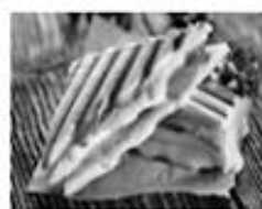
MISTO-QUENTE R$ 2,00