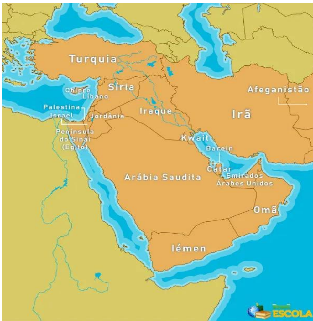
Mapa dos países do Oriente Médio.

4- O mapa ilustra os países que compõem a região do continente asiático denominada Oriente Médio.